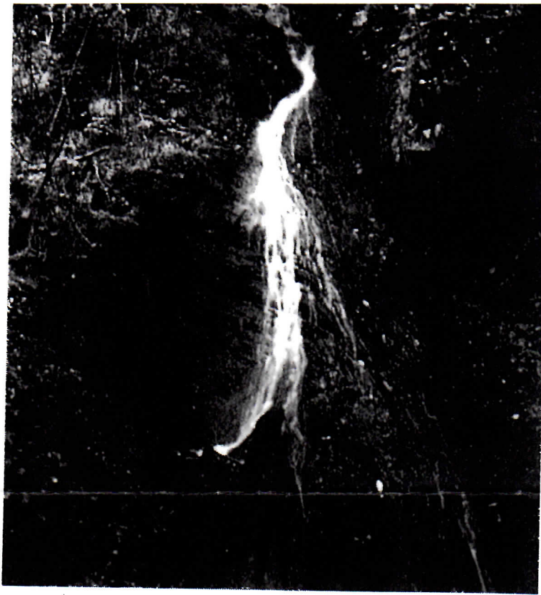
上：美しい白滝 下：ひと筋の水が流れるワサビ大滝